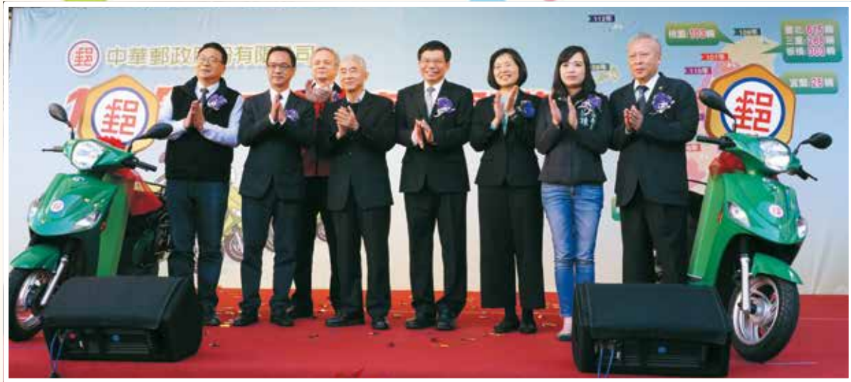
▲ 107/01/15 響應政府環保政策，中華郵政啓用 1627 輛電動車。