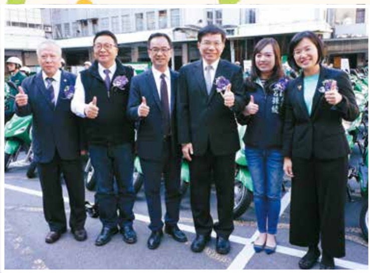
▶ 107/01/15 本會鄭光明理事長、立委陳歐珀、李昆澤、中華郵政公司王國材董事長、立委呂孫綾、蘇巧慧（由左至右）一齊為電動車加油。