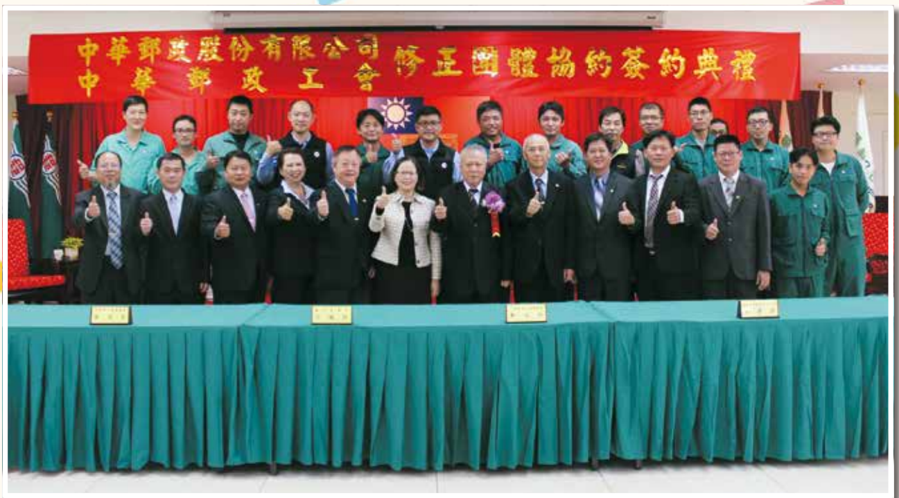
106/11/28 本會簽約代表、幹部感謝人力資源處協助團體協約簽約事宜。