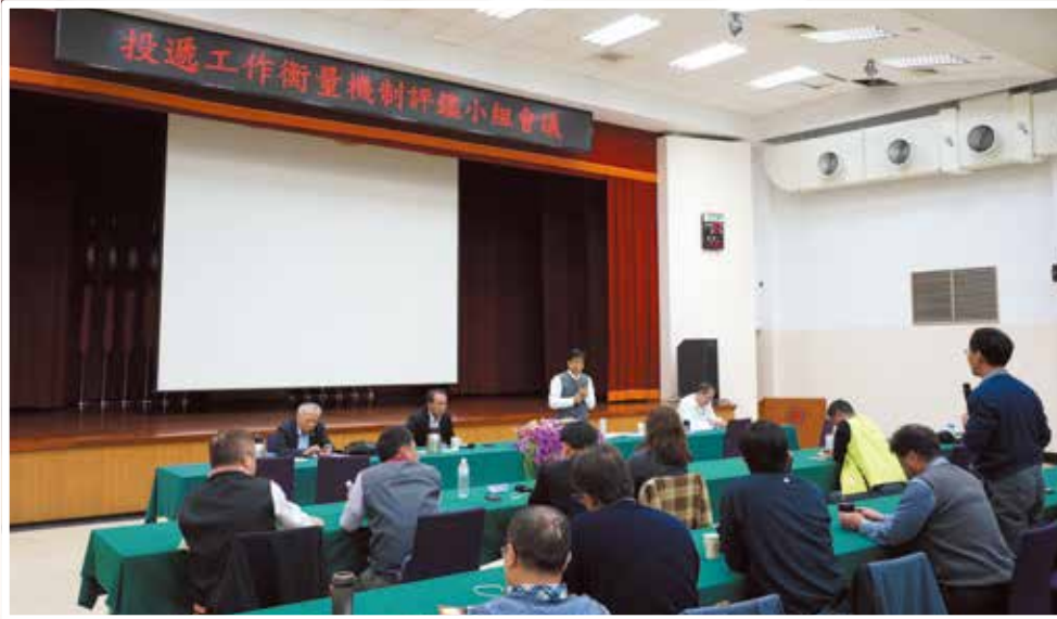
107/01/17 投遞工作衡量機制評鑑小組會議在臺北郵局召開。