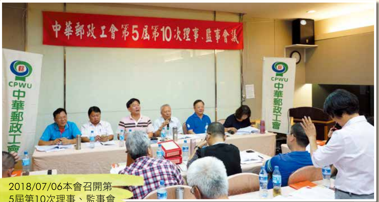
2018/07/06本會召開第5屆第10次理事、監事會議。