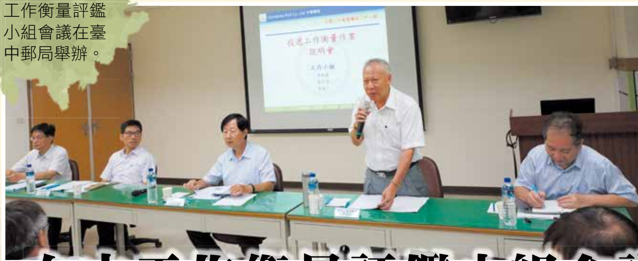
2018/06/22 工作衡量評鑑 小組會議在臺 中郵局舉辦。