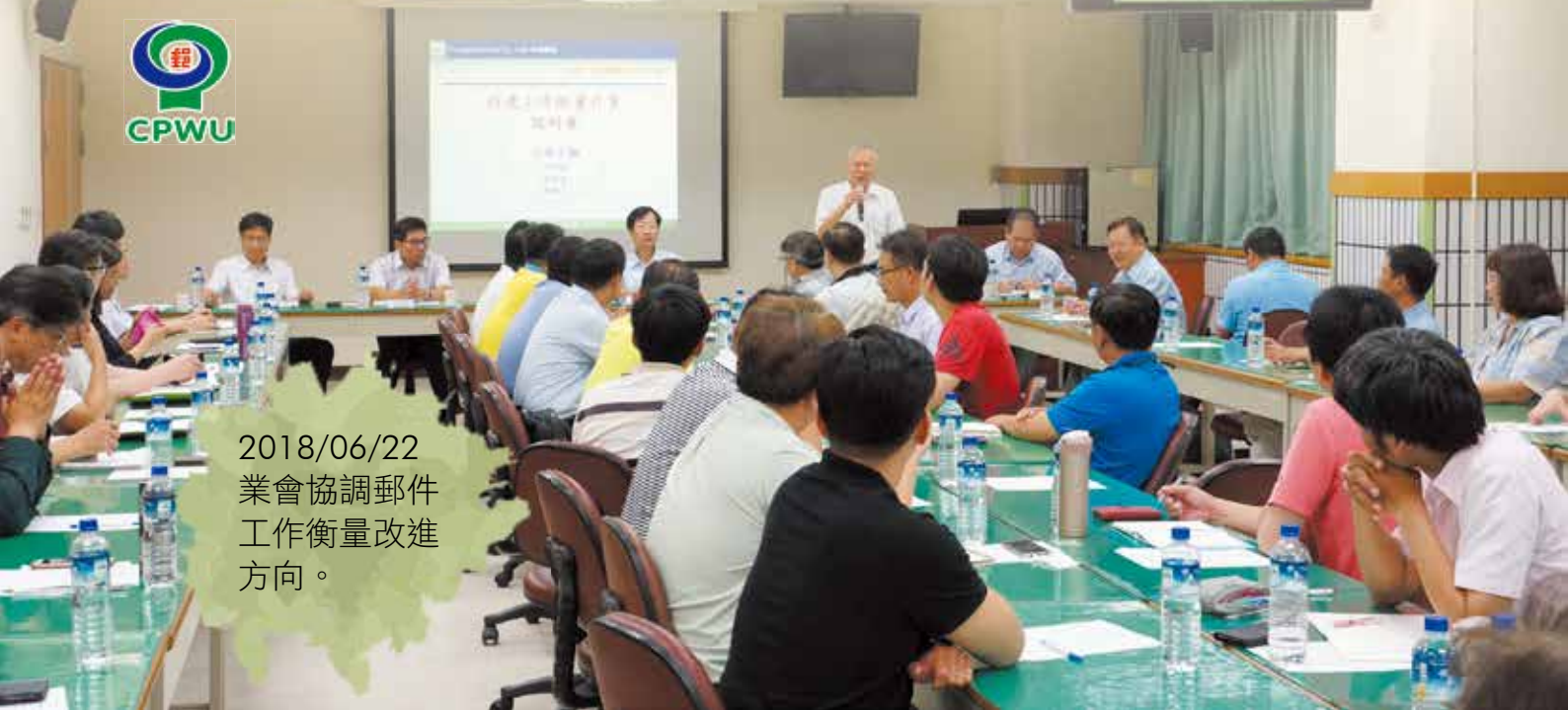
2018/06/22 業會協調郵件 工作衡量改進 方向。