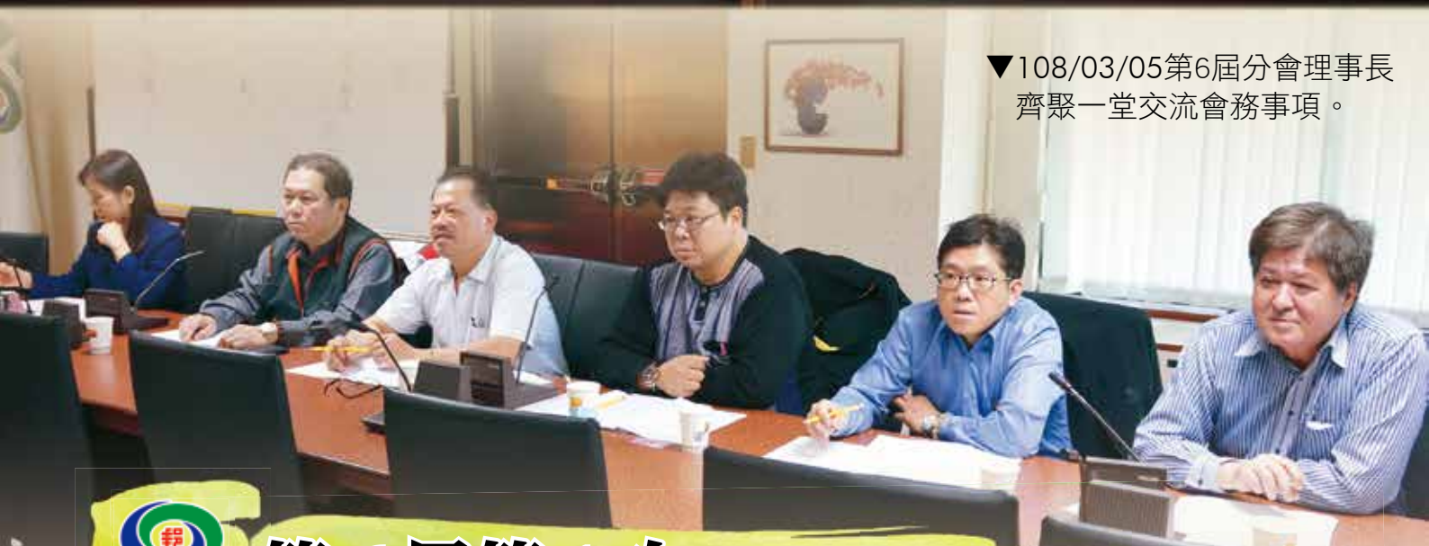
▼108/03/05第6屆分會理事長齊聚一堂交流會務事項。