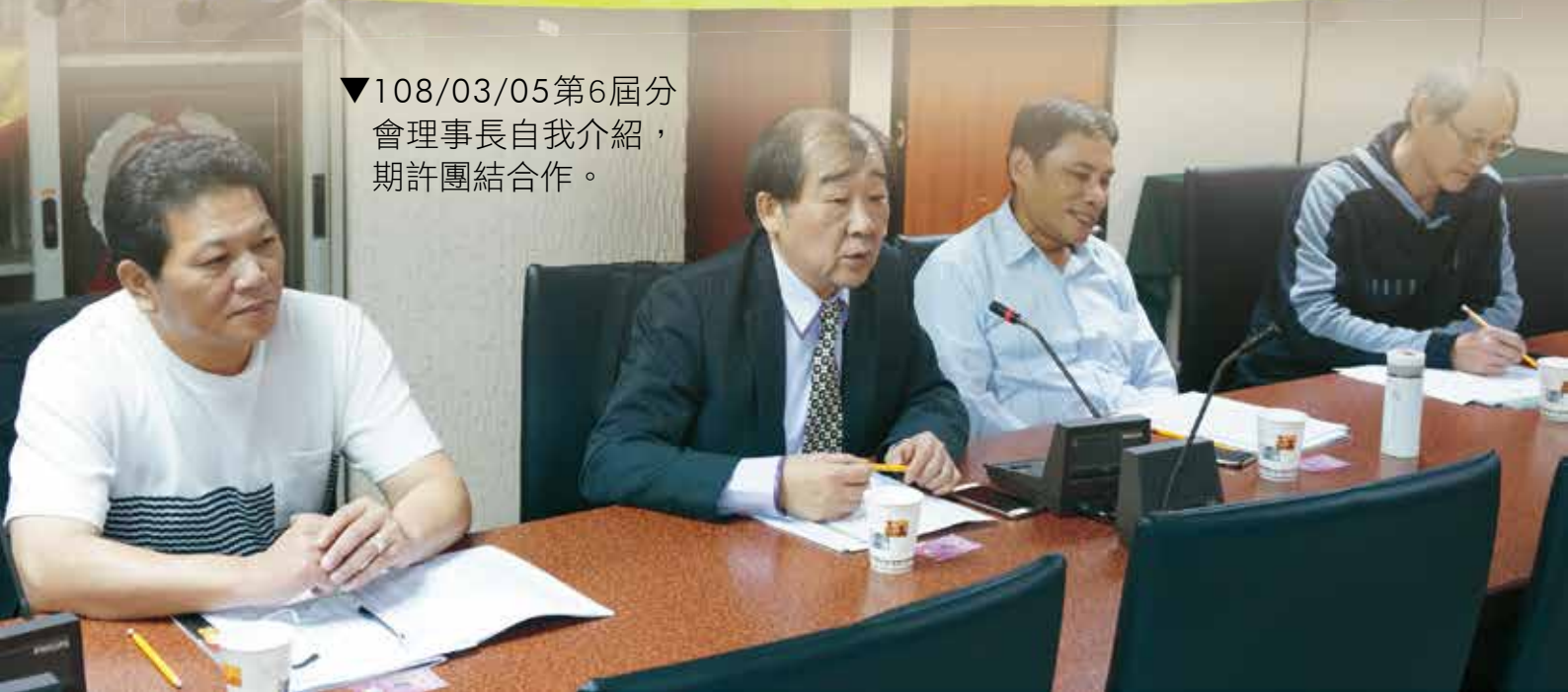
▼108/03/05第6屆分會理事長自我介紹，期許團結合作。